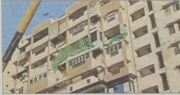
मुखर्जी नगर स्थित सिग्नेचर व्यू अपार्टमेंट। • फाइल फोटो