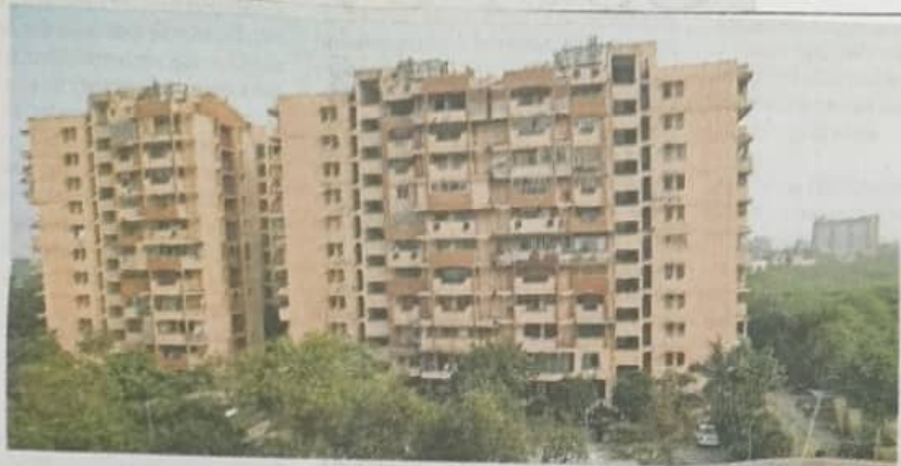
The building was declared unfit for habitation, said the MCD in its eviction order. Tashi Tobgyal

THE TIMES OF INDIA, NEW DELHI SATURDAY, DECEMBER 23, 2023