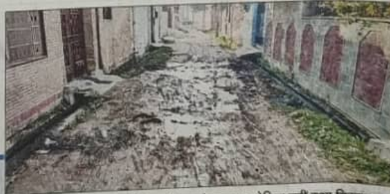
यह गांव साल 2006 में ही शहरीकृत हो गया था, लेकिन नहीं हुआ विकास

ग्रामीणों का आरोप है कि पिछले 7 साल से गांव में किसी भी तरह का विकास कार्य