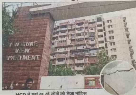
MCD ने यहां रह रहे लोगों को भेजा नोटिस

2007-09 में बने सिग्नेचर व्यू अपार्टमेंट में 336 फ्लैट्स हैं। लेकिन निर्माण कार्य