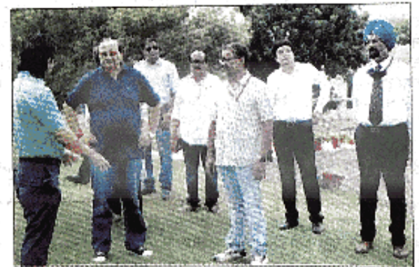
वरिष्ठ अधिकारियों संग उपराज्यपाल विनय कुमार सक्सेना।

एलजी ने स्पोर्ट्स कॉम्प्लेक्स के सदस्यों और उपयोगकर्ताओं से बातचीत की जिन्होंने कुछ जगहों पर साफ-सफाई की समस्या बतायी। इस पर एलजी ने