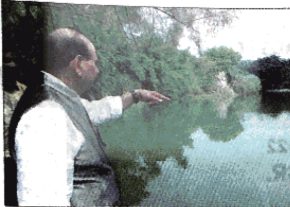
▶ नीला हौज बायो-डाइवर्सिटी पार्क का दौरा करते एलजी विनय कुमार सक्सेना।

जानकारी के अनुसार इस बायो डाइवर्सिटी पार्क को नीला हौज झील के रूप में विकसित किया गया है। यह एक प्राकृतिक जल निकाय है और दक्षिण दिल्ली को पीने के पानी की आपूर्ति के लिए इसका उपयोग किया जाता रहा है। झील के पास पीडब्ल्यूडी द्वारा अरुणा आसिफ अली सड़क पुल के निर्माण की वजह से लगभग विलुप्त हो गई थी। डीडीए द्वारा कुछ महत्वपूर्ण कदम उठाकर