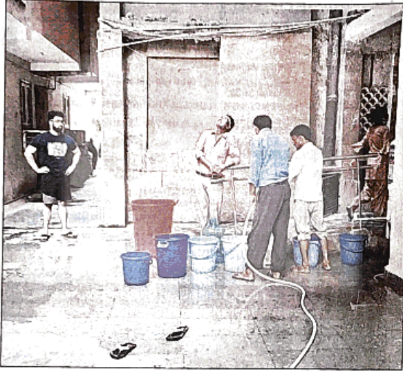
टैंकर से पानी मिलने के बाद लोग इस पानी को बाल्टी से भर भर कर आठवीं मंजिल तक ले जाने को मजबूर हैं, मार्केट में बढ़ी पानी की बोतलों की डिमांड

वसंत कुंज की गिनती साउथ दिल्ली के पॉशा इलाकों में होती है, लेकिन यहां के लोगों को इन दिनों पानी की समस्या से जूझना पड़ रहा है। हालात यह हैं कि लोगों को टैंकर के पानी से गुजारा करना पड़ रहा है। लोग इस पानी को बाल्टी से भर भर कर आठवीं मंजिल पर ले जाने को मजबूर हैं। वसंत कुंज के गंगा जमुना अपार्टमेंट में दो तरह की बिल्डिंग हैं। एक सामान्य बिल्डिंग जो चार मंजिला बनी हुई है। वहीं, दूसरी हाई राइज बिल्डिंग है जो आठ मंजिला है। पानी की यह समस्या गंगा जमुना अपार्टमेंट के सभी हाई राइज बिल्डिंग में है। इस बिल्डिंग में करीब 684 घर ऐसे हैं जिन घरों में पानी बीते चार-पांच दिनों से बिल्कुल ही नहीं आ रहा है।