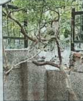
बांकनेर गांव के महिला पार्क की टूटी बाउंड्री की नहीं किसी को सुध

नरेला: भोरगढ़ और कुरैनी गांव के डीडीए पार्क बदहाल नजर आए। कुरैनी पार्क में हरियाली गायब हो चुकी है। लोगों का कहना है कि धूल-मिट्टी की वजह से वे यहां आना पसंद नहीं करते हैं। पार्क की बाउंड्रीवॉल कई जगह से टूटी हुई है। नरेला के बांकनेर गांव की गौडा रोड महिला पार्क की हालत भी खस्ता है। पार्क की एक दीवार पिछले कई महीनों से टूटी हुई है। पार्क में एक समर्सिबल लगाने का काम भी चल रहा है लेकिन बोरवेल खुल हुआ है जो कभी भी हादसे की वजह बन सकता है।