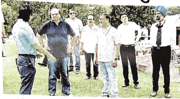
कुतुब गOLF कोर्स में अधिकारियों के साथ मुआयना करने पहुंचे उपराज्यपाल वीके सक्सेना (नीली टी शर्ट में)

जागरण संवाददाता, दक्षिणी दिल्ली : उपराज्यपाल (एलजी) वीके सक्सेना ने रविवार को सीरी फोर्ट स्पोर्ट्स कॉम्प्लेक्स और कुतुब गOLF कोर्स का दौरा किया। उन्होंने यहां दिल्ली विकास प्राधिकरण (डीडीए) की ओर से उपलब्ध कराए जा रहे खेल संबंधी व अन्य सुविधाओं, शूटिंग रेंज, स्वीमिंग पूल, इंडोर बैडमिंटन स्टेडियम का भी जायजा लिया। एलजी सक्सेना के साथ डीडीए के उपाध्यक्ष सहित अन्य कई उच्चाधिकारी मौजूद रहे। एलजी ने अधिकारियों को परिसर में साफ-सफाई का विशेष ध्यान रखने के निर्देश दिए।