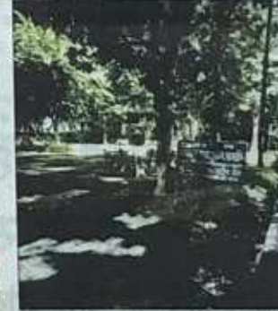
रोहिणी के सेक्टर-6 परशुराम पार्क में लाइट नहीं होने से अंधेरा छा जाता है