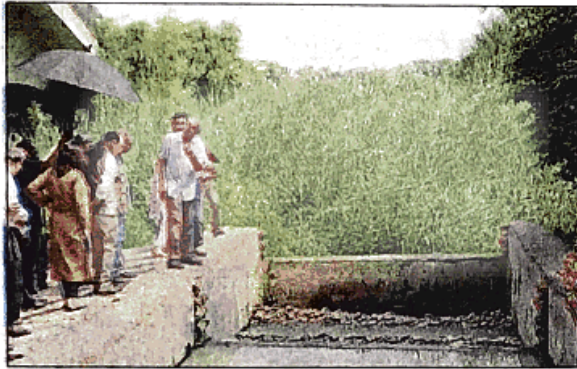
Saxena directed officials to explore the possibility of developing Neela Hauz-like water treatment systems over major drains in Delhi

Developed over seven acres of land, the Neela Hauz lake, now been transformed into a biodiversity park, is a natural waterbody and used to supply drinking water to south Delhi. It was nearly extinct or dead due to rapid urbanisation and construction