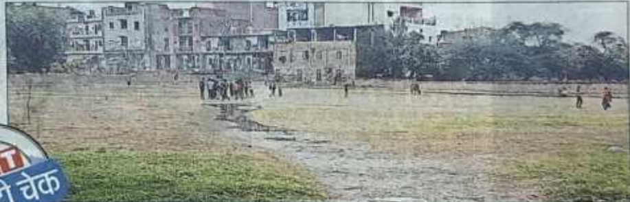
कुरैनी गांव का डीडीए पार्क भी बदहाल है, यहां हरियाली काफी कम है और बाउंड्री वॉल कई जगह से टूटी है

नरेला: भोरगढ़ और कुरैनी गांव के डीडीए पार्क बदहाल नजर आए। कुरैनी पार्क में हरियाली गायब हो चुकी है। लोगों का कहना है कि धूल-मिट्टी की वजह से वे यहां आना पसंद नहीं करते हैं। पार्क की बाउंड्रीवॉल कई जगह से टूटी हुई है। नरेला के बांकनेर गांव की गौडा रोड महिला पार्क की हालत भी खस्ता है। पार्क की एक दीवार पिछले कई महीनों से टूटी हुई है। पार्क में एक समर्सिबल लगाने का काम भी चल रहा है लेकिन बोरवेल खुल हुआ है जो कभी भी हादसे की वजह बन सकता है।