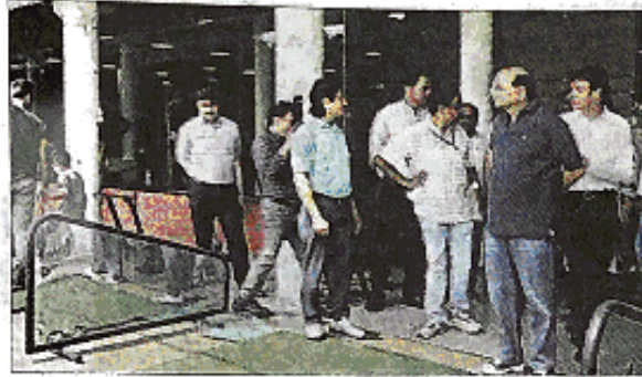
श्रीफोर्ट स्पोर्ट्स कॉम्प्लेक्स का निरीक्षण करते उपराज्यपाल।