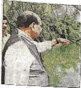
उपराज्यपाल वीके सक्सेना ने नीला हौज जैव विविधता पार्क का किया दौरा

नई दिल्ली। उपराज्यपाल वीके सक्सेना ने शनिवार को दक्षिणी दिल्ली स्थित नीला हौज जैव विविधता पार्क का दौरा किया। इस दौरान उन्होंने दिल्ली विकास प्राधिकरण (डीडीए) द्वारा निर्मित नमभूमि प्रणाली (सीडब्ल्यूएस) को अनुकरणीय मॉडल बताया। साथ ही अन्य प्रमुख नालों पर सीवेज के पानी के प्राकृतिक उपचार के लिए समान व्यवस्था विकसित करने की संभावना तलाशने का निर्देश दिया। उपराज्यपाल को डीडीए अधिकारियों ने बताया कि निर्मित नमभूमि प्रणाली (सीडब्ल्यूएस) एक प्राकृतिक जल शोधन प्रणाली है, जिसमें दो ऑक्सीकरण/तालाब स्थिरिकरण, निस्पंदन क्षेत्र और जलीय पौधों के माध्यम से बिना किसी शक्ति का उपयोग किए सीवेज के पानी का इन-सीटू उपचार शामिल है। इस व्यवस्था से उपचारित पानी की गुणवत्ता को देखते हुए सक्सेना ने अधिकारियों को अन्य प्रमुख नालों पर इस तरह की व्यवस्था विकसित करने के लिए निर्देश दिया है। बता दें कि नीला हौज जैव विविधता पार्क को नीला हौज झील के रूप में विकसित किया गया है, जो एक प्राकृतिक जल निकाय है और दक्षिणी दिल्ली को पीने के पानी की