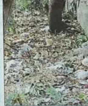
पीतमपुरा के यूपी ब्लॉक, पॉकेट 52 के पार्क में फैला कचरा