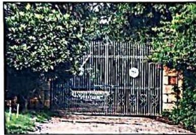
IN BAD SHAPE

New Delhi: A south Delhi resident, who had moved National Green Tribunal (NGT) highlighting the degradation of Smriti Van and the pollution in Machli Talab inside it, has raised several objections to a report filed by the forest department and the inability of Delhi Development Authority (DDA) to fix the issues.