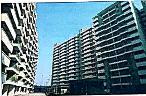
EWS flats stand tall in Loknayakpuram

Since the first day of the booking on September 10, the scheme has received an impressive response with all HIG flats offered at Jasola being sold out on Day 1, the statement said. The latest to join the bandwagon were flats in Dwarka, where a balanced inventory