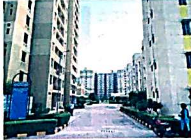
Several projects in pipeline. The proposed Rithala-Narela-Kundli metro rail corridor and Urban Extension Road project will further boost connectivity in the area. Many healthcare facilities are also on the anvil in Narela, which will aid growth of the sub city. There are many works under-

were sold out on Day one. The latest to join the bandwagon were flats in Dwarka, where balance inventory of one penthouse, three super HIG, 18 HIG and majority of MIG got sold in the bidding. The demand can be gauged from the fact that for 169 flats, around 2,000 people deposited the EMDs and after several rounds of bidding, the flats were sold at much above the reserve price. The success story of Narela has been quite encouraging as DDA has taken several steps for the development of the promising sub-city. It is being developed as the upcoming education hub of Delhi, with many institutions being already operational and sev-