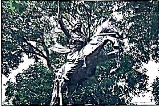
ईदगाह के पास पार्क में इस प्रतिमा को स्थापित किया जाएगा।

निगम के वरिष्ठ अधिकारी के अनुसार, डीडीए की जमीन पर काम शुरू किया गया है। उन्होंने बताया कि उच्च न्यायालय ने वक्फ बोर्ड के दावे को खारिज कर दिया। इसमें ईदगाह के पास स्थित पार्क की जमीन पर दावा किया गया था। कोर्ट के फैसले के बाद चारदीवारी का काम शुरू कर दिया है।