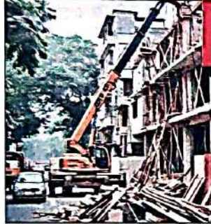
मॉनिटरिंग कमिटी ने किया दौरा, डीसी को ऐक्शन टेकन रिपोर्ट जमा करने का दिया आदेश

अधिकारी भी मौजूद रहे। निरीक्षण के दौरान महिपालपुर और वसंत कुंज बायपास रोड पर सड़क के दोनों ओर मास्टर प्लान 2021 की जमकर अन्देखीं होतीं मिलीं। कमिटी को जगह-जगह अवैध निर्माण और नॉन-नोटिफाइड रोड पर कमर्शल गतिविधियां चलतीं मिलीं। महिपालपुर में गेस्ट हाउसों की भरमार है, जहां सड़क पर अतिक्रमण मिला। डीडीए की ज़मीन पर अवैध पार्किंग और निर्माण सामग्री पड़ी मिली।