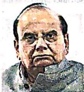
L-G V.K. Saxena

For felling trees in forest area in Delhi, prior permission had to be mandatorily obtained from the Su-