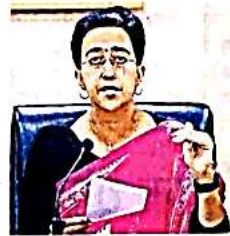
मुख्यमंत्री आतिशी •

राज्य ब्यूरो, जागरण • नई दिल्ली: दिल्ली सरकार ने कच्ची कालोनियों (अनधिकृत कालोनियों) में रहने वालों को बड़ी राहत की घोषणा की है। अब लोगों को कच्ची कालोनियों में बिजली कनेक्शन के लिए डीडीए से एनओसी लेने की जरूरत नहीं होगी। बिना एनओसी 15 दिन में बिजली कनेक्शन मिलेगा। मुख्यमंत्री आतिशी ने बुधवार को प्रेसवार्ता कर कहा कि बिजली कंपनियों को आदेश दे दिए गए हैं कि अब कच्ची कालोनियों में मीटर लगाने के लिए किसी भी एनओसी की जरूरत नहीं होगी। दिल्ली की 1,731 कच्ची कालोनियों में बिजली का मीटर लगवाने के लिए लोगों को अब किसी भी प्रकार के एनओसी की जरूरत नहीं होगी।