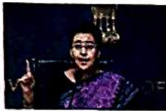
Chief minister Atishi

Chief Minister Atishi revealed this decision during a press conference, stating that electricity connections will be provided within 15 days with-