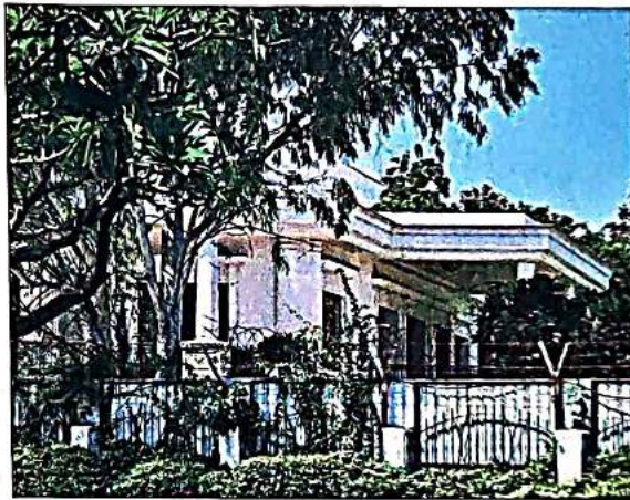
The 6, Flagstaff Road bungalow at Civil Lines.

The Flag Staff Road bungalow has been at the centre of a con-