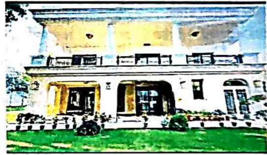
छह फ्लैग स्टाफ रोड स्थित दिल्ली के मुख्यमंत्री का आवास

• राष्ट्रीय पार्टी के मुखिया होने के नाते टाइप सात बंगले की पात्रता रखते हैं केजरीवाल