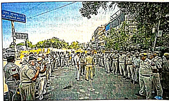
There was heavy police deployment in the area.

"The statue was brought to the park by MCD on Wednesday and DDA is in process of installing it," said a DDA spokesperson. The statue was lifted using a crane and placed in the park. The move is aimed at decon-