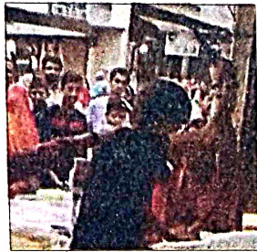
Screen grab of the attack

In the video, which was widely shared on social media, the boy can be seen threatening a shopkeeper, identified as