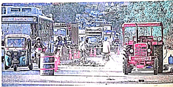
सरिता विहार फ्लाईओवर पर एक्सपेंशन ज्वाइंट बदलने के कारण आश्रम से फरीदाबाद जाने वाले मार्ग पर लगा भीषण जाम • विपिन शर्मा

मथुरा रोड से प्रतिदिन एक लाख से ज्यादा वाहनों की आवाजाही होती है। सरिता विहार फ्लाईओवर एनसीआर के नोएडा और फरीदाबाद क्षेत्रों को दक्षिण-पूर्वी दिल्ली और बदरपुर से जोड़ता है। इसकी मरम्मत का काम दो महीने की अवधि में चार चरण में पूरा किया जाएगा। एक चरण में 15 दिन होंगे। पहले दो चरणों में 30 दिनों तक आश्रम से बदरपुर जाने वाले फ्लाईओवर की मरम्मत का काम किया जाएगा। इसके बाद तीसरे और चौथे चरण