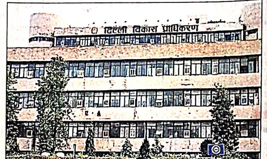
DDA was told to rectify the issues and reapply for the certificate