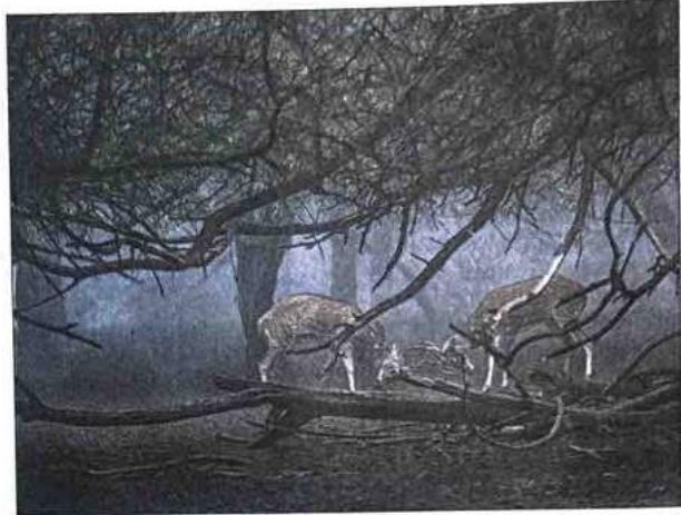
Deer lock antlers at Deer Park in New Delhi.

The court asked the body to speak at the highest level regarding its suggestions, saying the remaining deer can be sent to