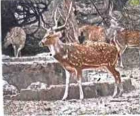
हौज खास स्थित डियर पार्क में हिरण

पीठ ने कहा कि राजस्थान के जंगल में बहुत सारे तेंदुए हैं। ये हिरण वहां जीवित नहीं रहेंगे। कम से कम, 50 हिरण डियर पार्क रखें। अदालत ने यह आदेश 600 जानवरों के स्थानांतरण के विरुद्ध नई दिल्ली नेचर सोसायटी द्वारा दायर जनहित याचिका पर दिया। याचिका में कहा गया है कि क्रमशः 70 प्रतिशत और 30 प्रतिशत के अनुपात में हिरणों के स्थानांतरण के निर्णय को मंजूरी देते समय शर्तों का पालन नहीं