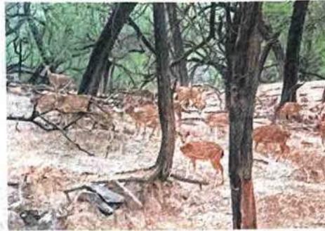
The recognition of the AN Jha Deer Park in Hauz Khas as a mini zoo was cancelled in June.

It also suggested that at least 50 deer can be maintained inside the park. "Speak to the people at the highest level, maintain