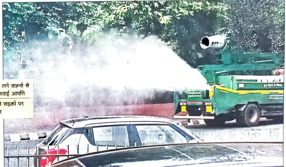
आईटीओ पर वायु प्रदूषण को रोकने के लिए सोमवार को एंटी स्मॉग गन से पानी का छिड़काव करते हुए।

अधिकारी ने बताया कि सड़कों के किनारे जमी