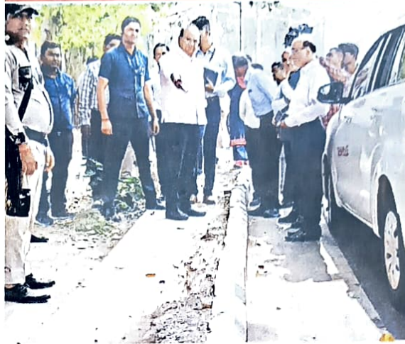
रिंग रोड पर पड़ी गाद अधिकारियों को दिखाते एलजी वीके सक्सेना

एलजी ने राजघाट से आइटीओ, प्रगति पावर प्लांट, आईपी एस्टेट, मिलेनियम पार्क का किया दौरा