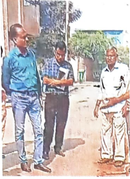
कृष्णा के स्वजन (दाएं) से बात करते डीडीए के अधिकारी

जागरण संवाददाता, बाहरी दिल्ली: सिरसपुर गांव में डीडीए के एकता अपार्टमेंट में गेट गिरने से पांच वर्षीय बच्चे की मौत के मामले में एक सप्ताह में डीडीए अधिकारियों की टीम ने दूसरी बार घटनास्थल का दौरा किया और आरडब्ल्यू व बच्चे के स्वजन से बात की। अधिकारियों ने बच्चे के स्वजन से मिलकर घटना पर दुख जताया और न्याय का भरोसा दिलाया। बच्चे के स्वजन के उस सवाल से डीडीए अधिकारियों को असहज हो गए, जिसमें उन्होंने सवाल किया कि जब सबको पता था कि गेट टूटा है, फिर उसे ठीक क्यों नहीं कराया गया। अधिकारियों ने आरडब्ल्यू के पदाधिकारियों से भी बात की और हादसे के बारे में पूछा।