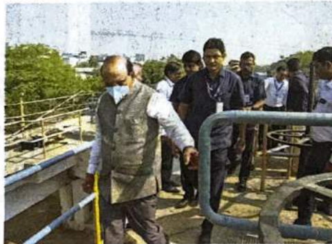
V.K. Saxena has been pushing for rapid development in the Narela sub-city.

This, the L-G underlined, would, apart from ensuring stake, also ensure recurring income to the