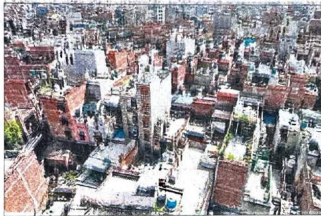
उत्तरपूर्वी जिले की अनधिकृत कॉलोनी। अमर उजाला

दरअसल, अनधिकृत कॉलोनियों में अमूमन मकानों को तोड़ने या सील करने का अभियान चलता रहता है। करीब 1797 अनधिकृत कॉलोनियां रिहायस छिन जाने की तलवार हर वक्त लोगों के सिर पर लटकी रहती है। इसमें अनधिकृत कॉलोनियों के साथ क्लस्टर व झुग्गी बस्ती शामिल है। इसमें बड़ी संख्या में मध्यम व गरीब वर्ग के लोग रहते