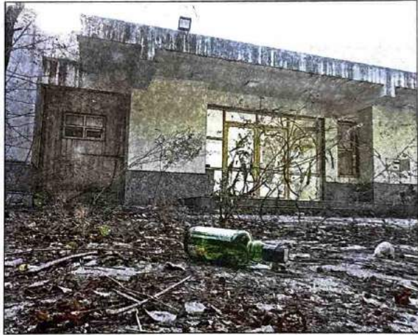
IN RUINS: Neglected condition of DDA sports complex at Sukhdev Vihar