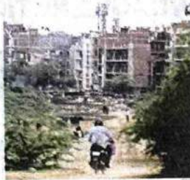
So far, the Delhi government has identified 1,731 unauthorised colonies