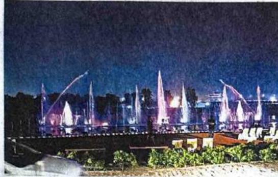
इसी बांसेरा पार्क में अंतरराष्ट्रीय पतंग महोत्सव का होगा आयोजन

गुजरात की तर्ज पर राष्ट्रीय राजधानी में भी पहली बार अंतरराष्ट्रीय पतंग महोत्सव का आयोजन होगा। यह महोत्सव दिल्ली को एक नई पहचान देगा तो यहां के निवासियों को भी नए साल में गुनगुनी धूप के बीच कला-संस्कृति, खानपान एवं मनोरंजन के एक नए आयाम से रूबरू कराएगा। एलजी वीके सक्सेना के सुझाव पर इस अनूठे आयोजन की पहल दिल्ली विकास प्राधिकरण (डीडीए) के स्तर पर की जा रही