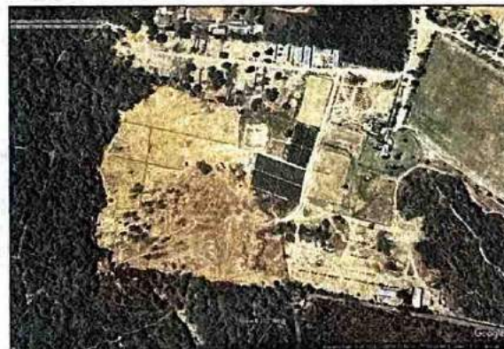
MAPPING VIOLATIONS: A Google Earth image of Central Ridge on December 6, 2021, (top) and April 16, 2023