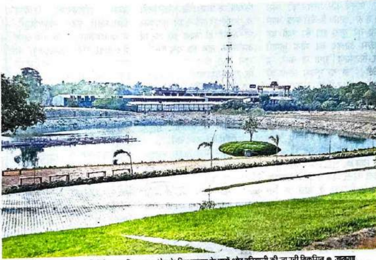
सराय काले खा स्थित बांसेरा पार्क में तैयार म्यूजिकल फाउंटन के लिए तालाब के चारों ओर हरियाली की जा रही विकसित • जागरण

यमुना किनारे बन रहे बांसेरा थीम पार्क के पूरा होने की तिथि आगे बढ़ सकती है। इस पार्क को 31 दिसंबर तक पूरा करने की तिथि निर्धारित की गई है। पार्क का एक बड़ा हिस्सा दिल्लीवालों के स्वागत के लिए तैयार है, लेकिन जुलाई में उफनाई यमुना के कारण सुंदरीकरण का कार्य धीमा पड़ गया था। इस वजह से यह पार्क अपने पूर्ण स्वरूप में नहीं आ पाया है। डीडीए के अधिकारियों का कहना है कि अधिकांश कार्य को तय तारीख तक पूरा कर लिया जाएगा।