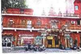
गीता भवन मंदिर, मालवीय नगर