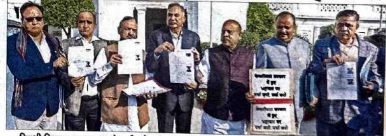
विपक्षी विधायक लगातार नारेबाजी और हंगामा करते रहे। कुछ विधायकों ने सदन में प्लेकार्ड भी दिखाए