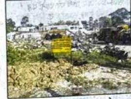
अतिक्रमण के खिलाफ बुलडोजर

■ विस, नई दिल्ली : डीडीए ने जीटी रोड पर वेलकम मेट्रो स्टेशन से सटी लगभग 4000 वर्गमीटर की जमीन को अवैध कब्जे से मुक्त करके उस पर अपना बोर्ड लगा दिया। डीडीए की इस जमीन पर पिछले कई दशक से अवैध रूप से केमिकल गोदाम चल रहा था। डीडीए अधिकारियों का कहना है कि मुक्त कराई गई जमीन का इस समय मार्केट 100 करोड़ से अधिक है।