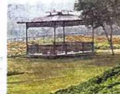
सराय काले खा स्थित बांसेरा पार्क का विहंगम दृश्य • जागरण

यहां एक सोलर पार्क तैयार किया जा रहा है। इसकी क्षमता दो मेगावाट की होगी। इससे उत्पादित बिजली बीएसईएस को दी जाएगी। वो बांसेरा समेत उनके अन्य जगहों पर बिजली सप्लाई देगी। इससे डीडीए को बिजली के खर्च निकालने में भी मदद मिलेगी।