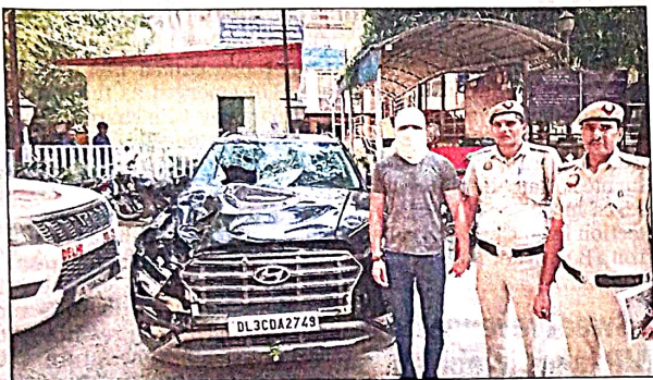
Police scanned footage from over 100 CCTV cameras to track the accused