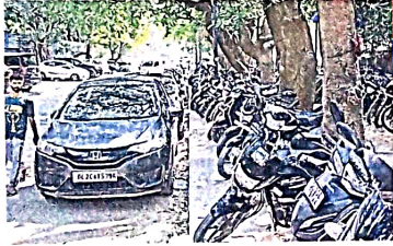
नेहरू प्लेस मार्केट में फुटपाथ से लेकर सड़क पर पार्क हो रहे वाहन, पैदल चलने वालों को होती है परेशानी • जागरण

जागरण संवाददाता, दक्षिणी दिल्ली: नेहरू प्लेस मार्केट एशिया का सबसे बड़ा कंप्यूटर हार्डवेयर बाजार है। एनसीआर समेत अन्य राज्यों से करीब साढ़े तीन लाख ग्राहक रोजाना यहां आते हैं। करीब 16 हजार कार्यालय और दुकानें हैं, जिनमें करीब डेढ़ लाख लोग काम करते हैं। एमसीडी की 15 पार्किंग की क्षमता करीब 1,300 वाहनों की है। यहां फुटपाथ से लेकर सड़कों तक पार्किंग माफियाओं ने कब्जा कर रखा है। वहीं अंदर मार्केट में अवैध रेहड़ी-पटरी वालों का अतिक्रमण है।