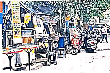
मार्केट में रेहड़ी-पटरी वालों ने फुटपाथ पर कर रखा है कब्जा • जागरण