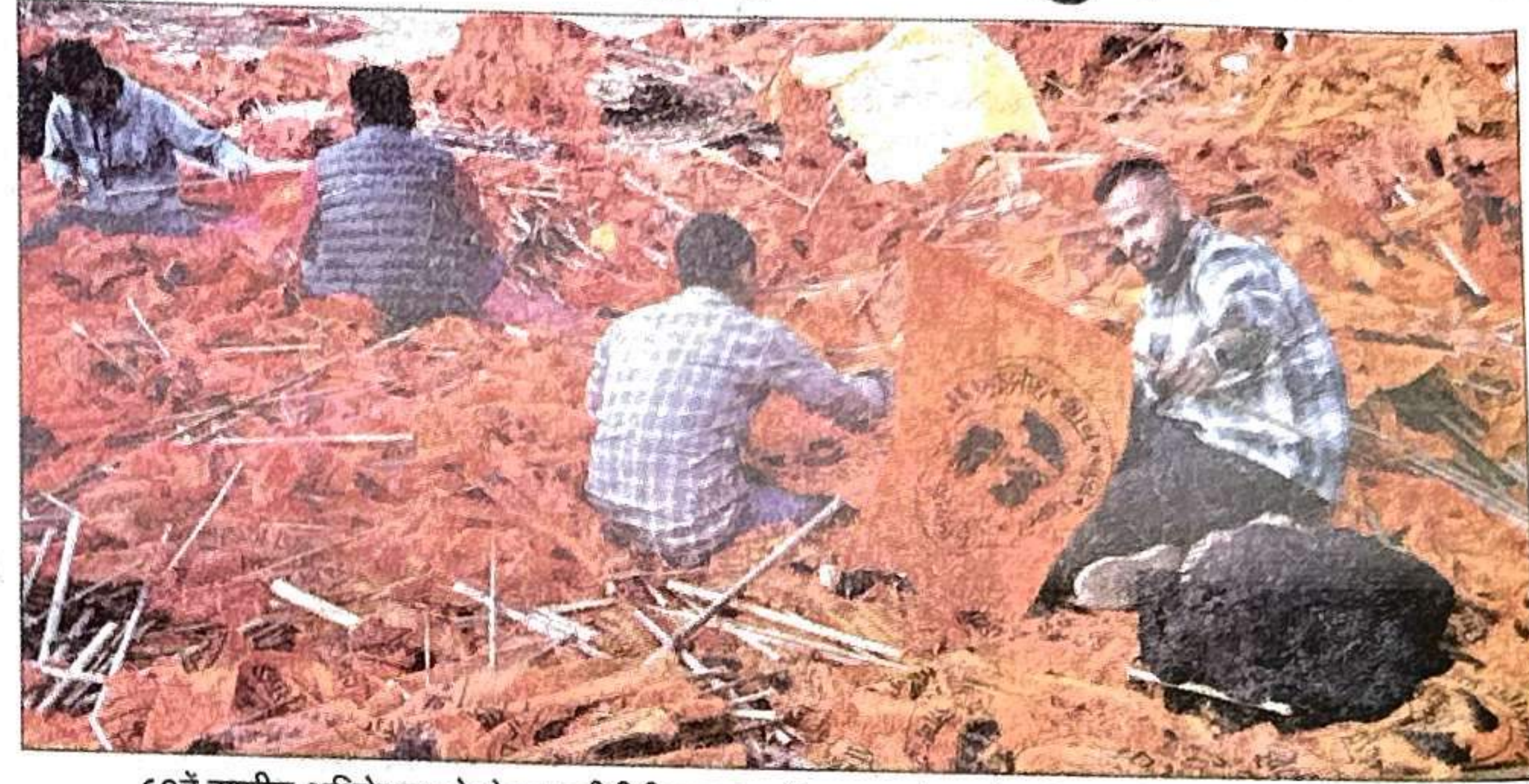
69वें राष्ट्रीय अधिवेशन को लेकर एबीवीपी का झंडा तैयार करते कार्यकर्ता।