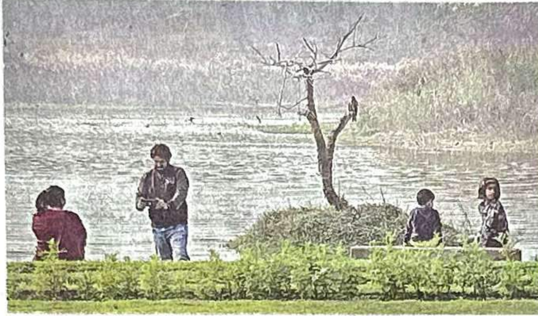
असिता ईस्ट में जलाशय के पास फोटो लेते लोग व बैठे बच्चे

दिल्ली विकास प्राधिकरण (डीडीए) की ओर से यमुना रिवर फ्रंट के तहत खादर क्षेत्र में विकसित किए गए असिता ईस्ट में फिर से रौनक लौट आई है। लोग भी प्रकृति के निकट पहुंचकर सैर का आनंद लेने पहुंच रहे हैं। वहीं सेल्फी प्वाइंट, जलाशय के किनारे बैठकर खूबसूरत दृश्यों को अपने कैमरे में कैद कर रहे हैं। दो-तीन महीनों पहले यमुना का जलस्तर बढ़ने से असिता ईस्ट को तैयार करने में डीडीए की सारी मेहनत पर पानी फिर गया था। लेकिन डीडीए के उद्यान विभाग ने हालात सामान्य होने के बाद फुटपाथ ट्रैक को