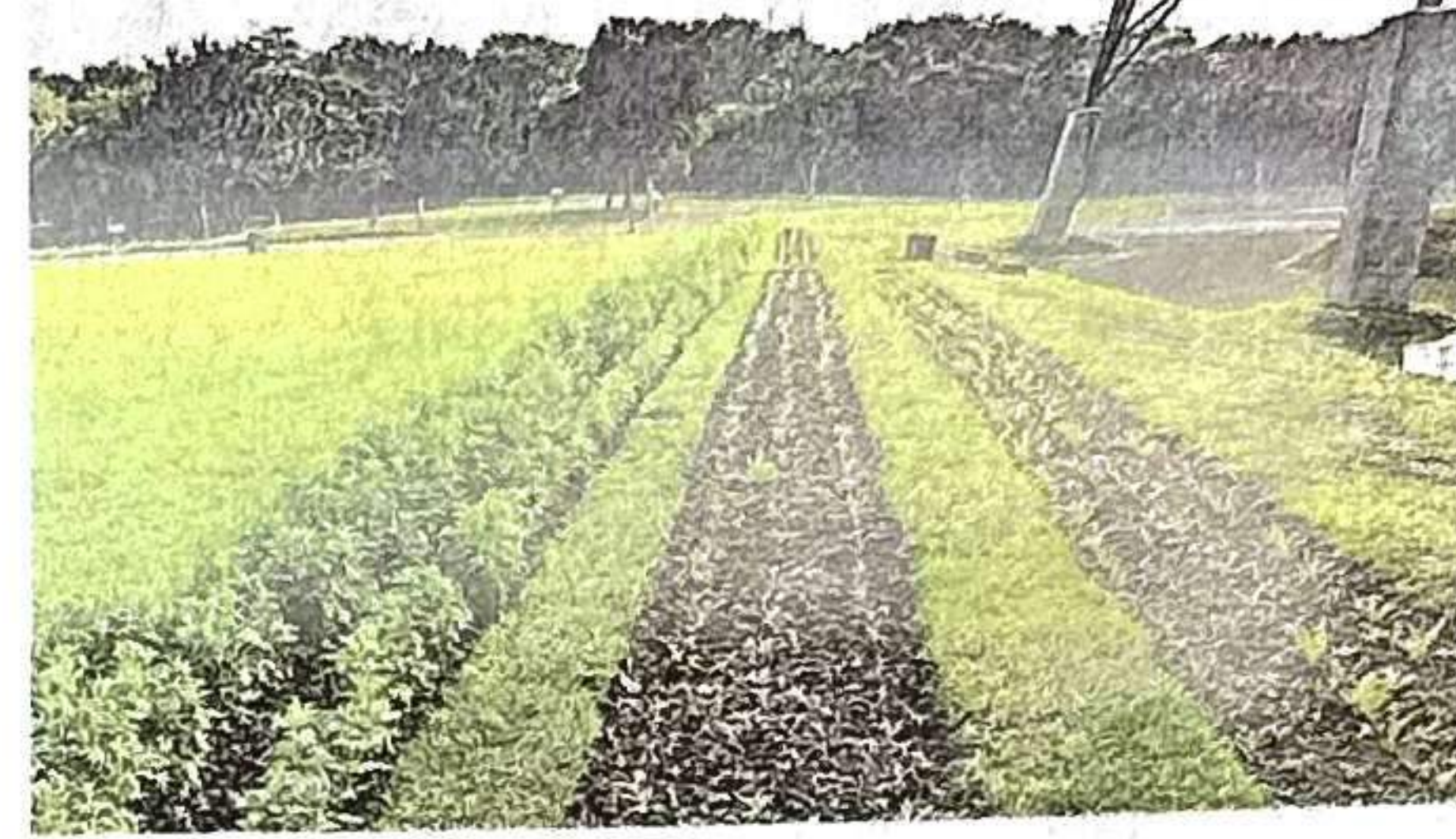
क्यारी बनाकर लगाए गए फूलों के पौधे • जागरण

बताया कि बाढ़ से यहां पौधे नष्ट हो गए थे। अब दोबारा से डहेलिया, बबूने, नीलकूपी, कैलेंडुला, हालिहाक जैसे नए पौधे लगाकर