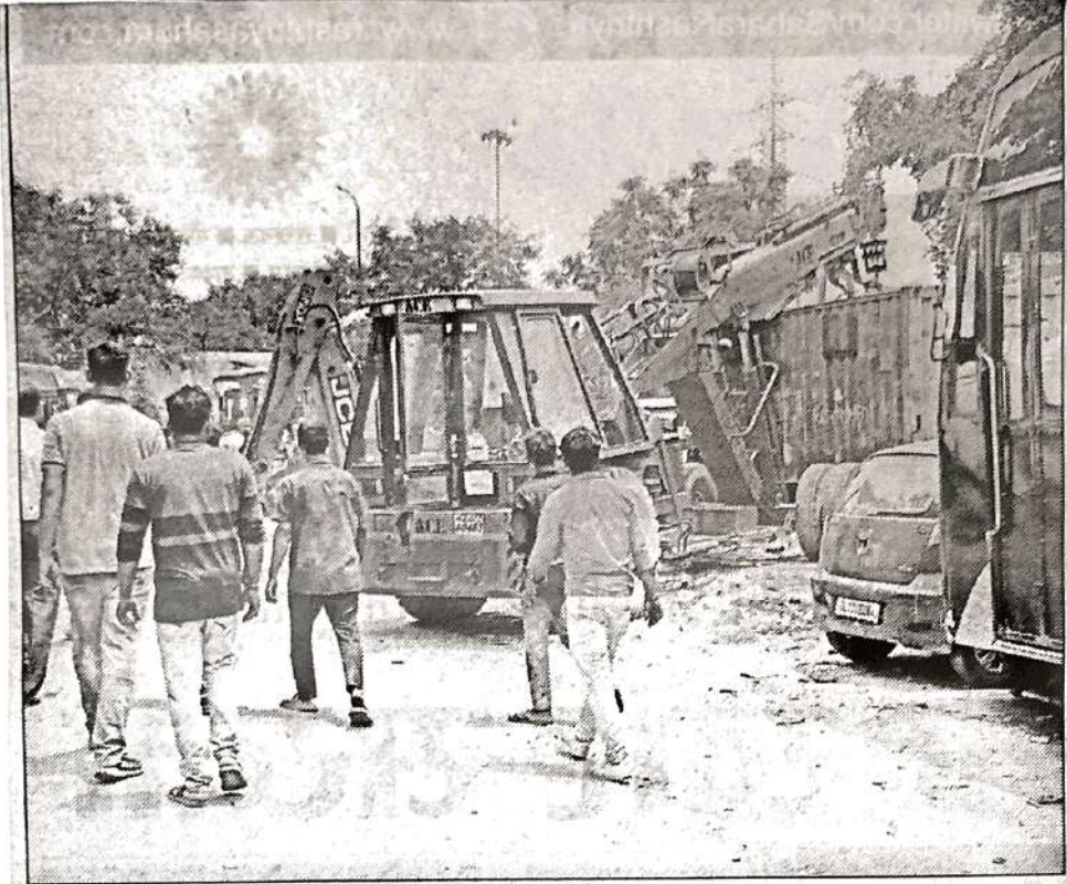
तिमारपुर में अतिक्रमण हटाने पहुंचा डीडीए, एमसीडी व आरपी सेल के अधिकारी।