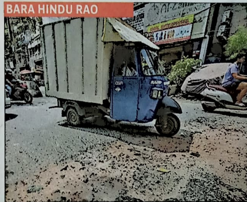
BARA HINDU RAO