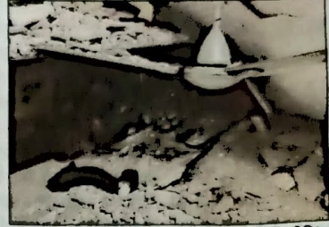
अपार्टमेंट के डी-ब्लॉक के एक फ्लैट में गिरी सीलिंग

इस मामले में डीडीए ने कहा कि डीडीए लोगों को अपना ऑफर दे चुका है और आरडब्ल्यू की जनरल बांडी का लेटर भी डीडीए को मिल चुका है। इसमें कई सुझाव दिए गए हैं। अभी तक फ्लैट ऑनर की तरफ से डीडीए को कोई रिस्पॉन्स नहीं मिला है। एलजी वी के सक्सेना इस पूरे मामले की खुद मॉनिटरिंग कर रहे हैं।