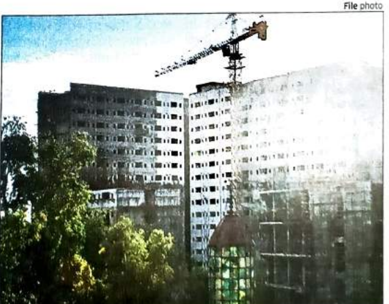
After the construction, there will be a computerised draw of lots

The one-bedroom are being developed on a public-private partnership basis and in 2022, the authority decided to hand over the first batch of 700 flats by September but couldn't meet the deadline. "There were some disputes over the payment, so progress on the project had slowed down. Now, the project has picked up the pace. While the eligibility of beneficiaries was verified long back, those living in slums and willing to shift to DDA flats in Narela have been allotted accommodations provisionally,"