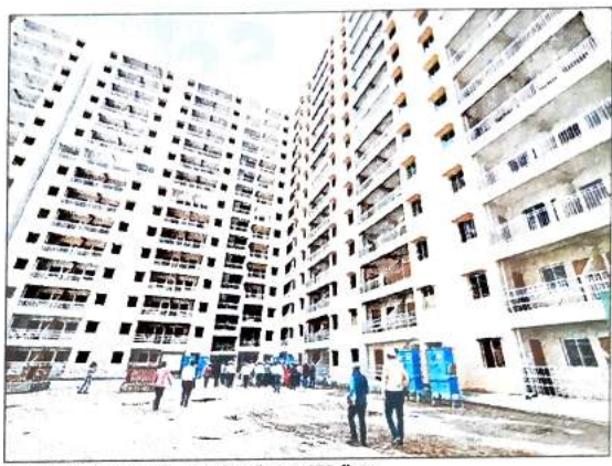
The 14-storey housing project has 1,675 flats

With an area of 340 square feet, each of these flats have a bedroom, a living room, a kitchen, separate toilet and bathroom and a balcony. "While the total residential built-up area of the project is approximately 67,000 square metre, the covered area for community facilities is nearly 1000sqm. It also has a provision for par-