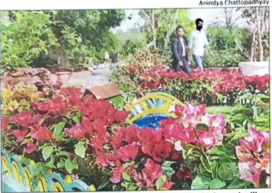
COLOURFUL VISTA: Delhi tourism is organising the bougainvillea festival at Garden of Five Senses in Said-ul-Ajab till Sunday

bougainvillea, a shrub or vine from South American, is one of the most widely grown plant plants here. 'It's a species that does well in a tropical area, be it South America, the US or India. It is tough and can survive only on rain. When temperatu-