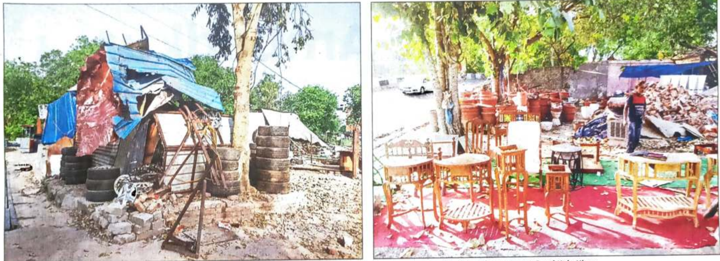
TROUBLED STRETCH: On Thursday, TOI noticed that the furniture stalls and car repair shops were again operating from the spot near Sarai Kale Khan