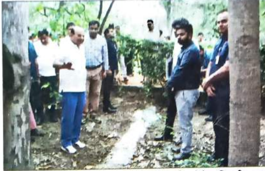
सफाई कार्य के दौरान अधिकारियों को निर्देश देते एलजी।

झील के पुनरुद्धार और बेहतर रखरखाव के लिए डीडीए को दिये गये डी-सिल्टिंग, मरम्मत और रखरखाव, मृत पेड़ों को हटाने और झील की सफाई के कार्य को सही तरीके से किया जा रहा है। एलजी को बताया गया कि संजय झील के समानांतर स्थित एनएच-24 और आसपास के कई रिहायशी इलाकों से बहने वाले बारिश के पानी को उनके निर्देशानुसार