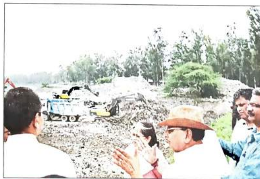
TAPPING THE POTENTIAL: If deepened by 2.5 metres, the lake will be able to hold nearly 53 million litres of water

At the same time, the sewage discharge from certain