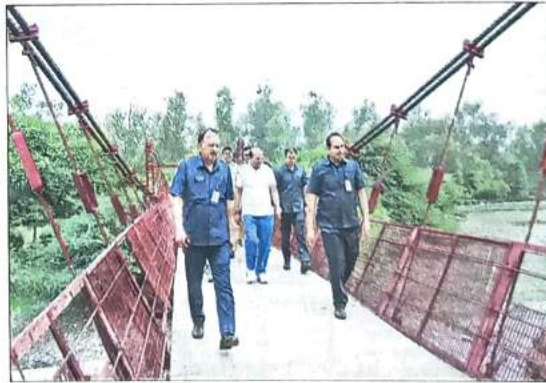
LG VK Saxena during his visit to Sanjay Lake on Sunday.

"The LG instructed Delhi Development Authority and Delhi Jal Board officials to carry out thorough de-silting and dredging of the lake and deepen it by 2.5m before the onset of monsoon," the LG office said in a statement. "After it is deepened by 2.5m, this lake will be able to hold nearly 53 million