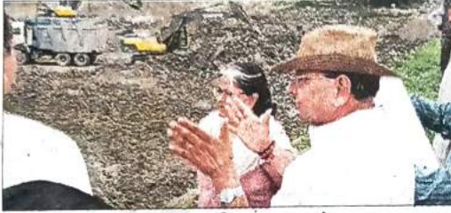
दिशानिर्देश देने उपराज्यपाल विनय कुमार सक्सेना।

झील से गाद निकालने का करीब 60 फीसदी पूरा कर लिया गया है। एलजी ने मौजूदा कार्य पर संतोष जताते हुए कहा कि 30 जून तक सभी जलाशयों को पुनर्जीवित करने के लिए अधिकारियों को कदम