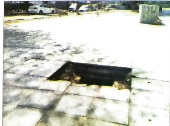
फुटपाथ पर इस तरह से बगैर ढक्कन के खुले पड़े हैं मैनहॉल।