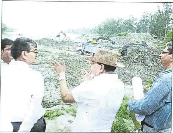
दिल्ली के उपराज्यपाल वीके सक्सेना ने रविवार को लेक का निरीक्षण किया।

उप राज्यपाल ने डीडीए के अधिकारियों को सूखे हुए पेड़ों को हटाने, नियमित तौर पर गाद साफ करने, झील के रख-रखाव आदि के निर्देश दिए। डीडीए के अधिकारियों की ओर से बताया गया कि राजमार्ग 24 से बरसाती पानी को झील तक पहुंचाने के लिए पहले ही पाइप लाइन बिछाई जा चुकी है।