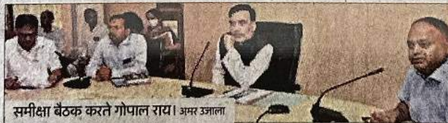
समीक्षा बैठक करते गोपाल राय।

पिछले साल की सफलता के बाद दिल्ली सरकार की तरफ से 16 बिंदुओं पर केंद्रित समर एक्शन प्लान तैयार किया जा रहा है। पर्यावरण मंत्री गोपाल राय की अध्यक्षता में बृहस्पतिवार को दिल्ली सचिवालय में समीक्षा बैठक हुई। इसमें 30 विभागों ने रिपोर्ट और सुझाव पर्यावरण विभाग को सौंपी। गोपाल राय ने इसी आधार पर पर्यावरण विभाग को विस्तृत कार्ययोजना बनाने के