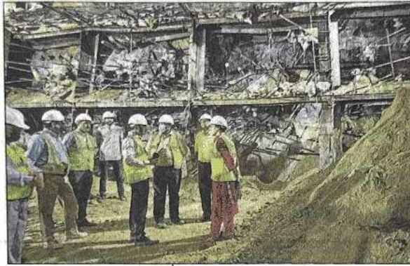
PWD minister Atishi inspects the Bhairon Marg underpass, part of the Pragati Maidan tunnel project, on Thursday.

A senior PWD official said that these railway crossings are located in densely populated areas. "As the city has expanded, we have seen development of new colonies along