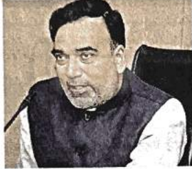
पर्यावरण मंत्री गोपाल राय

पर्यावरण मंत्री गोपाल राय ने बताया कि प्रदूषण की रोकथाम के