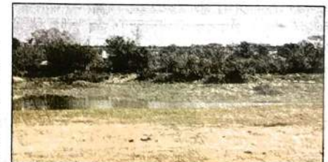
रीडिवेलपमेंट के बाद सीलमपुर, शास्त्री पार्क, शाहदरा और आसपास के इलाकों को होगा फायदा

डीडीए ने यहां शास्त्री पार्क साइट पर करीब एक लाख पौधे लगाने का लक्ष्य तय किया है। इस पूरे क्षेत्र का मेकओवर किया जा रहा है। इसके लिए यमुना के बाढ़ क्षेत्र की सफाई, वहां से कूड़े, मलबे और अतिक्रमण को हटाने के काम किए जाने हैं। इसके अलावा प्रदूषण बढ़ाने वाली गतिविधियों जैसे स्टाटर हाउस की गंदगी को यहां डालने को बंद किया जाना है। दो मुख्य झीलों की