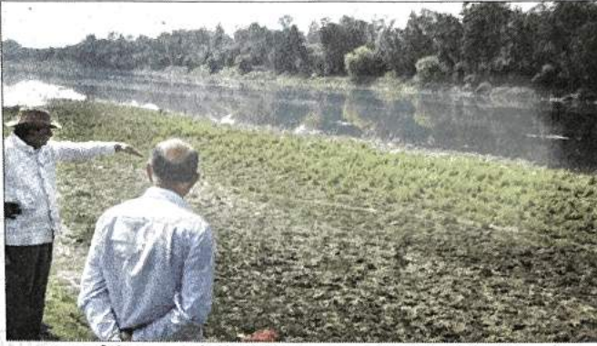
यमुना नदी के बाढ़ग्रस्त क्षेत्र के दौरे के दौरान अफसरों को दिशा निर्देश देते एलजी।

उपराज्यपाल कार्यालय के अनुसार, उपराज्यपाल ने रविवार को पूर्वी दिल्ली में बाढ़ से प्रभावित होने वाले क्षेत्र शास्त्री पार्क-बेला फार्म-गढ़ीमेंडू क्षेत्र का निरीक्षण किया और अधिकारियों को 11 किलोमीटर लंबे क्षेत्र को साफ करने, पुनर्स्थापित करने और कायाकल्प करने का निर्देश दिया। यह क्षेत्र