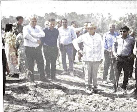
L-G took an on-site stock of the situation, instructed officials to immediately ensure steps to clean, restore and rejuvenate the degraded flood plains

The DDA will plant one lakh trees at Shastri Park apart