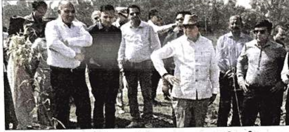
यमुना खादर क्षेत्र का निरीक्षण करते उपराज्यपाल व अन्य अधिकारी।

उपराज्यपाल वीके सक्सेना ने उत्तर-पूर्वी दिल्ली स्थित शास्त्री पार्क, बेला फार्म, गढ़ी मांडू खंड का निरीक्षण किया। उनके साथ डीडीए के अधिकारी भी मौजूद रहे। 11 किलोमीटर के क्षेत्र को निरीक्षण करने