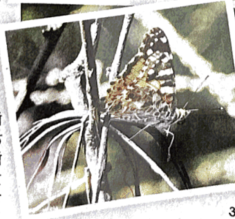
पेंटेड लेडी, ब्लू टाइगर, एशियन कैबेज वाइट और लार्ज कैबेज वाइट जैसी तितलियां दिख रही हैं।