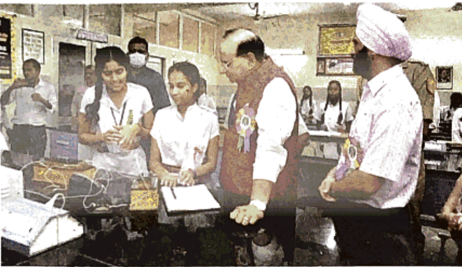
STAFF REPORTER ■ NEW DELHI

Delhi Lieutenant Governor Vinai Kumar Saxena on Saturday inaugurated and laid the foundation of several initiatives, including 41 Science Labs of 21 Schools renovated by the New Delhi Municipal Council (NDMC) to foster Scientific Temper among students and the foundation stone of the World class sports