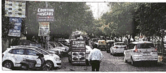
करोल बाग में किया गया अतिक्रमण।