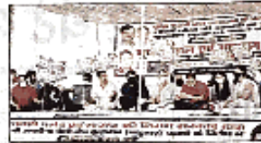
लोगों को मिला आम नेता का साथ