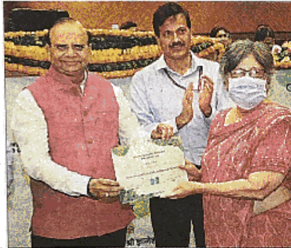
जीरो वेस्ट कॉलोनियों की आरडब्ल्यू एवं ग्रुप हाउसिंग सोसाइटियों के प्रतिनिधियों को प्रमाणपत्र थितरित करते उपराज्यपाल।

नई दिल्ली। जीरो वेस्ट आरडब्ल्यू व ग्रुप हाउसिंग सोसाइटियों को उपराज्यपाल विनय कुमार सक्सेना ने हरित मित्र सम्मान देकर सम्मानित किया। इन सोसाइटियों को सहभागिता योजना के तहत एमसीडी की तरफ से संपत्तिकर में पांच फीसदी की अतिरिक्त छूट प्रदान की जाएगी। निगम ने अभी तक अपने 12 जॉन को 56 कॉलोनियों व ग्रुप हाउसिंग सोसाइटियों को जीरो वेस्ट कॉलोनी घोषित किया है। उपराज्यपाल ने शुक्रवार को निगम मुख्यालय सिविक सेंटर में सभी जीरो वेस्ट आरडब्ल्यू व ग्रुप हाउसिंग सोसाइटियों को प्रमाणपत्र प्रदान किया।