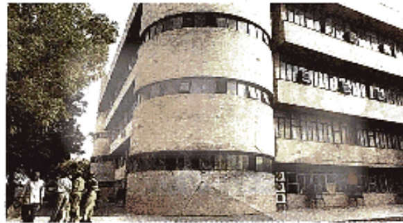
The DDA headquarters.

One of the proposed amendments will make pooling of land mandatory for the remaining landowners if the minimum participation rate of 70% landowners is achieved, while the other amendment grants powers to the Centre to declare land pooling mandatory, even if the minimum criteria - 70% participation and 70% conti-