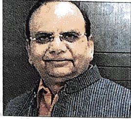
विनय कुमार सक्सेना

नई दिल्ली। उपराज्यपाल विनय कुमार सक्सेना ने दिल्ली के 77 सड़क कॉरिडोर पर भीड़ कम करने सहित तमाम लंबित कार्यों को तीन महीने के भीतर पूरा करने के निर्देश दिए हैं।