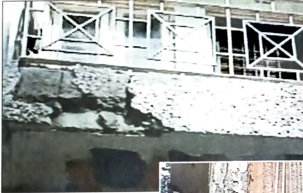
12 साल से नहीं हुई फ्लैटों की मेंटिनेंस