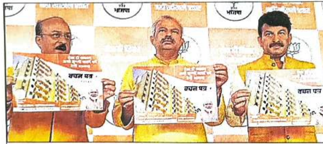
पार्टी दफ्तर में गुरुवार को वचन पत्र जारी करते भाजपा नेता।

पार्टी नेताओं ने वचन पत्र जारी कर झुग्गीवासियों से वादा किया