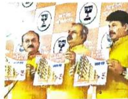
Delhi BJP leaders Adesh Gupta, Manoj Tiwari and Ashish Sood releasing the 'Vachan Patra' on Thursday.