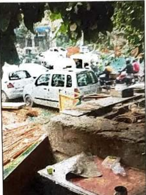
रोजाना लगता है जाम

साल भर से ट्रैफिक प्रभावित स्काईवॉक की सीढ़ियां और लिफ्ट आदि सत्यम सिनेमा रोड (आस्या कुंज मार्ग)