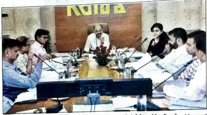
नोएडा प्राधिकरण में गीतमबुद्धनगर की तीनों प्राधिकरण की बोर्ड बैठक लेते अधिकारी।

जेपी के खरीदारों की मुश्किल बढ़ी : प्राधिकरण ने अपने तमाम आवंटियों को कई तरह की रियायतें दो हैं लेकिन जेपी की अधूरी परियोजनाओं को आगे समयवृद्धि मुफ्त न देने का फैसला किया है। इससे जेपी की परियोजनाओं में निवेश करने वाले निवेशकों को परेशान होना पड सकता है। दरअसल प्राधिकरण ने