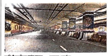
प्रगति मैदान सुरंग सड़क सड़क • जागरण आर्वाइव

दो जगह काम जारी प्रगति मैदान के रुथ में बड़ी परियोजना पूरी मार्ग से रिंग रोड पर जाने के लिए अंडरपास की बनाने का काम चल रहा है। आब्रम एक्सटेंशन पलाइंडोपर का भी काम चल रहा है। ये दोनों परियोजनाएं फरवरी तक पूरी करने का लक्ष्य है।