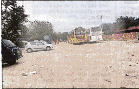
A MESS: The college had paid Rs 55 lakh to DDA to build a boundary wall, but the land is now encroached upon, the members said

The institute is funded by Delhi government.