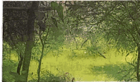
As per the website of National Mission on Monuments and Antiquities Anang Tal dates back to 1,060 AD

The notification also invites objections or suggestions over the next two months. "Any objection or suggestions, to the declaration of the said archaeological site and remains to be of national importance, may be made within a pe-