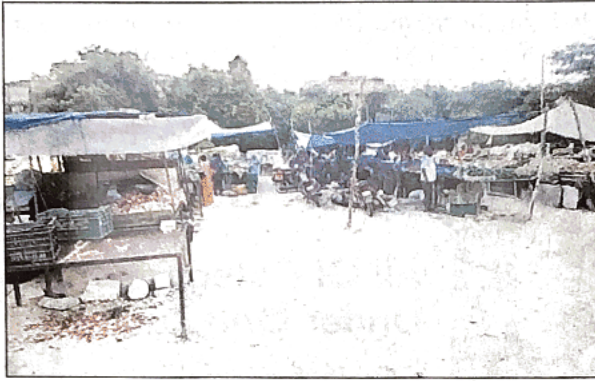
बाउंड्री के लिए डीडीए को रुपये देने के बाद भी न अतिक्रमण हटा न दीवार बनी