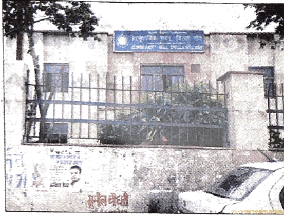
चिल्ला गांव स्थित डीडीए का सामुदायिक भवन।

नई दिल्ली, (पंजाब केसरी): एकला चलो नीति से चलने वाले पूर्वी दिल्ली के सांसद गौतम गंभीर ने गौतम कनेक्ट कार्यक्रम के तहत डीडीए के सारे नियम ताक पर रख दिए। सूत्रों का कहना है कि जिस सामुदायिक भवन बुकिंग के लिए लोग डीडीए की चौखट पर ठोकरें खाते हैं, उस सामुदायिक भवन की गौतम गंभीर ने गौतम कनेक्ट कार्यक्रम के तहत बुकिंग ही नहीं कराई गई। यहां डीडीए पर भी सवाल उठ रहे हैं कि सामुदायिक भवन जहां लोगों के लिए उपलब्ध नहीं हो पाता, वह सामुदायिक भवन गौतम को कार्यक्रम के तहत कैसे दे दिया गया। सांसद गंभीर पर भी आरोप लगाए जा रहे हैं कि उन्होंने अपना रसूख दिखा सरकारी संपत्ति का इस्तेमाल किया।