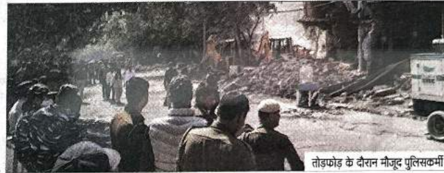
तोड़फोड़ के दौरान मौजूद पुलिसकर्मी।

नई दिल्ली, (पंजाब केसरी): दिल्ली विकास प्राधिकरण (डीडीए) की टीम ने लगातार पांचवें दिन स्थानिय लोगों के विरोध के बावजूद महरौली में अवैध मकानों पर कार्रवाई की। टीम ने मंगलवार को महरौली के भूल भुलैया इलाके में मकानों की तोड़फोड़ की है। बताया जा रहा है कि जिन लोगों के मकान पर स्टे नहीं मिला है, डीडीए उन्हीं मकानों पर कार्रवाई कर रही है। कार्रवाई का विरोध कर रहे स्थानिय लोगों का कहना है कि यह जमीन उन्हें अलॉट की गई थी और अचानक यह जमीन अवैध कैसे हो गई। वह पिछले कई सालों से यहां पर रह रहे हैं लेकिन अब डीडीए के लोग हमारे घरों को अवैध बताकर तोड़ रहे हैं, जबकि हमारा पूरा जमा पूंजी इन्हीं मकानों में लगी हुई है। हमारी बातों को कोई सुनने को तैयार नहीं है। मंगलवार सुबह 10 बजे से ही