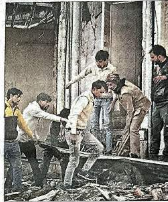
महरोली में लगातार पांचवें दिन मंगलवार को डीडीए ने तोड़फोड़ अभियान जारी रखा। इस दौरान डीडीए की टीम को लोगों के विरोध का भी सामना करना पड़ा। अमर उजाला