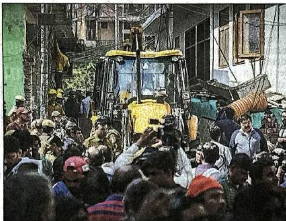
People gather around a backhoe loader demolishing a residential building in Mehrauli on Tuesday.

The demolition began last Friday, in the wake of a proposed G20 meeting at the park in South Delhi that has around 55 monuments under the protection of DDA, the state archaeological department, and the Archaeological Survey of India. Officials of Delhi's land-owning agency have so far insisted that the action is in consonance with directions by the Delhi high