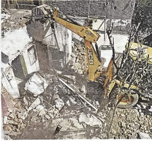
महरोली स्थित बस टर्मिनल के पास अतिक्रमण हटाता डीडीए का बुलडोजर

अतिक्रमण स्थल से 200 मीटर की दूरी है तहसील और थाना: खास बात