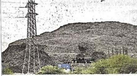
गाजीपुर स्थित लैंडफिल साइट • जागरण

बता दें कि यूईआर-दो (एनएच 344) 74.98 किमी लंबी रोड है। सबसे पहले वर्ष 2000 में दिल्ली विकास प्राधिकरण (डीडीए) ने इस रोड की परिकल्पना की थी। मूर्त रूप दे पाने में नाकाम रहने पर 2018 में इसे एनएचएआइ को सौंप दिया था। इस रोड के निर्माण के लिए डीडीए एनएचएआइ को लगभग 4,000 करोड़ रुपये की मदद करेगा। यूईआर-दो को पांच हिस्सों (पैकेजों) में बांटकर तैयार किया जा रहा है। रिंग रोड के तीसरे और चौथे