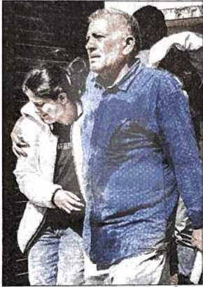
अवैध निर्माण पर डीडीए की मिलीभगत पर उठ रहे सवाल

डीडीए सूत्रों ने बताया कि अवैध निर्माण के खिलाफ एक्शन नहीं लेना है। मगर अपनी नौकरी भी अधिकारी को बचानी है, तो वे नोटिस जारी करने की खानापूर्ति कर देते हैं। एक्शन कभी नहीं लिया जाता। मामला बड़े स्तर पर उजागर होने पर वे बताते हैं कि नोटिस दिया जा चुका है। कार्रवाई नहीं होने का कारण वे फोर्स (पुलिस) नहीं मिलना और संबंधित कारण गिनाकर साफ बच जाते हैं। इसका फायदा अवैध निर्माण करने वाले बिल्डर उठाते हैं। रिजर्व फॉरेस्ट का मामला इसका ताजा प्रमाण है। डीडीए अधिकारी नाम नहीं छापने की शर्त पर बताते हैं कि फॉरेस्ट एरिया में कई साल पहले से एक्शन लिया जाता तो इतनी गंभीर स्थिति पैदा नहीं होती। अधिकारी मानते हैं कि बिल्डर के साथ डीडीए के संबंधित अधिकारियों की मिलीभगत के बगैर सैकड़ों अपार्टमेंट्स नहीं बन सकते थे।