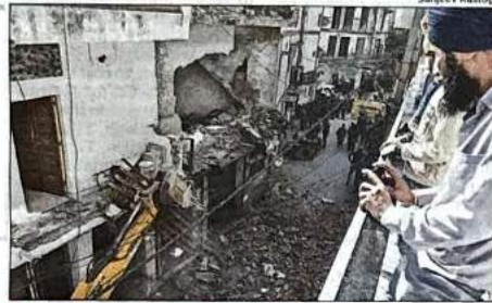
DREAMS MAKE A CRASH LANDING