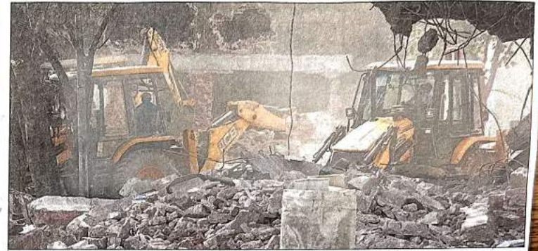
महारौली के भूलभुलैया इलाके में मंगलवार को तोड़फोड़ करता दिल्ली विकास प्राधिकरण का बुलडोजर। • सौरभ मेहता

अनुपालन किया। उन्होंने महारौली में कार्रवाई रोकने व नए सिरे से सीमांकन शुरू करने को लेकर दोबारा मंडलायुक्त व डीडीए उपाध्यक्ष को निर्देश जारी किया है।