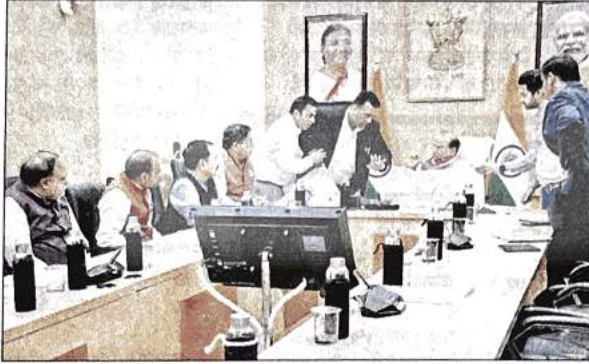
करीब एक घंटे तक चली बैठक में लोगों ने एलजी के समक्ष आपबीती सुनाई

लगातार पांच दिनों से महारौली के रिहायशी मकानों पर चल रहे बुलडोजर के खिलाफ बीजेपी नेता कुछ लोगों के साथ मंगलवार को एलजी के पास पहुंचे। नेताओं ने एलजी से कार्रवाई रोकने का अनुरोध किया। करीब एक घंटे तक चली बैठक में स्थानीय लोगों ने एलजी के समक्ष आपबीती सुनाई। उनकी बातें सुनने के बाद एलजी ने कहा कि बिना प्रशासनिक प्रक्रिया पूरी किए बिना कार्रवाई नहीं होगी। उन्होंने नेताओं और लोगों को तुरंत कार्रवाई बंद कराने का आश्वासन भी दिया।