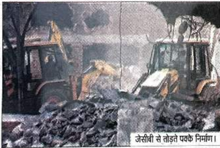
जेसीबी से तोड़ते पक्के निर्माण।