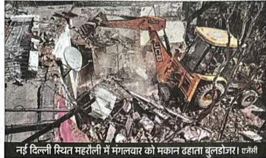
नई दिल्ली स्थित महरौली में मंगलवार को मकान ढहाता बुलडोजर।

उपराज्यपाल कार्यालय के अनुसार, एलजी ने आश्वासन दिया है कि जमीन के सही मालिक के साथ कोई अन्याय नहीं किया जाएगा। निवासियों की शिकायतों की पूरी तरह से जांच की