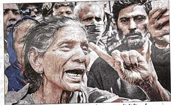
जिनके घर टूटे, उनके मायूस चेहरों और नम आंखों में हैं कई सवाल