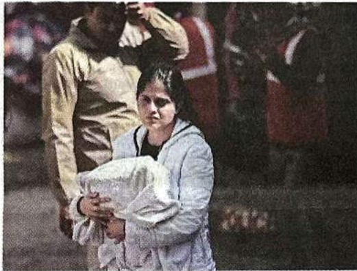
Saxena's orders came on the fifth day of the drive.

Meanwhile, the Delhi government said Gahlot had pulled up DM (South) for 'inaction' on the drive. Gahlot had directed the DM to carry out a "fresh demarcation of the disputed area" last Saturday. "DM (South) neither com-