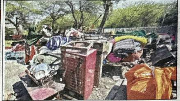
महौरली में अतिक्रमण पर चलता बुलडोजर (बाएं) सामान समेटती महिला।