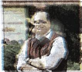
Delhi L-G V K Saxena

He directed the Delhi Development Authority (DDA) to immediately undertake the cleaning of the banks of the lake in preparation for the forthcoming Chhath festival and instructed all stakeholder agencies to parallelly start work