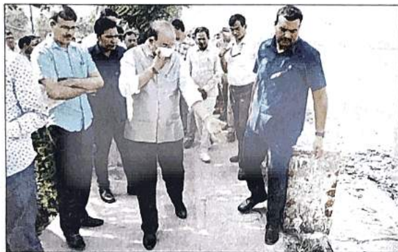
The Bhalswa lake has now shrunk to 34 hectares from 59 hectares

Located in north-west Delhi, the lake was originally spread over 59 hectares but shrunk to just 34 ha due to the deposition of silt and garbage. Officials said that DDA had handed over the waterbody to Delhi Jal Board for its restoration and rejuvenation in May 2019, but little work was done for its improvement. "The LG expressed his deep disappointment at the sordid and pathetic state of maintenance and upkeep of the lake by DJB, the designated agency in-charge for its rejuvenation. He has directed DDA to immediately undertake the cleaning of the banks of the lake in preparation for the upcoming Chhath festival and instructed all stakeholder agencies to start work on the complete restoration and rejuvenation of