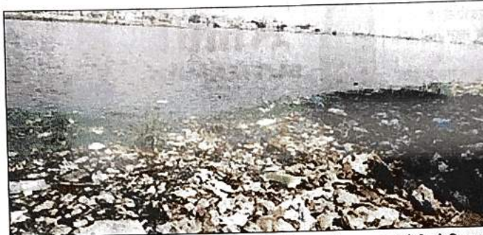
मई-2019 में डीडीए ने झीलों को पुनर्जीवित और विकसित करने का काम डीजेबी को दिया था

झील के निरीक्षण पर आए एलजी ने इसकी हालत देखकर हैरानी जाहिर की। उन्होंने कहा कि झील 59 एकड़ की है, लेकिन अब यह मृत होने की कगार है। झील सिकुड़कर महज 34 हेक्टेयर की रह गई है। इसमें एर्जेसियों की लापरवाही से गाद और कूड़ा बढ़ता जा रहा है। मई-2019 में डीडीए ने झीलों को पुनर्जीवित और विकसित करने का काम डीजेबी को दिया था, लेकिन डीजेबी इस काम को पूरा नहीं कर पाई। जिसके बाद डीडीए