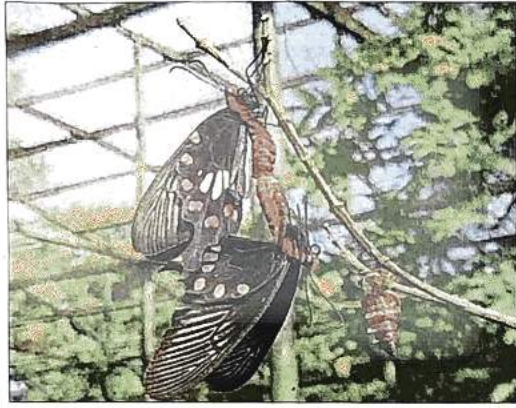
The common rose butterfly.

। नवभारत टाइम्स । नई दिल्ली । सोमवार, 17 अक्टूबर 2022