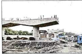
अभी चल रहा है पिलर बनाने का काम

नजफगढ़ फिरनी रोड पर हर समय जाम लगा रहता है। ट्रैफिक पुलिस ने यहां जाम की समस्या को कम करने के लिए वन-वे भी लागू किया है लेकिन लोगों को जाम से राहत नहीं मिलती है। पौक आवर्स के समय जो चंद्र किलोमीटर की दूरी घंटों में तय होती है। ऐसे में अब यूईआर-2 (तीसरी रिंग