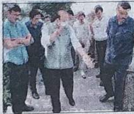
एलजी ने भलस्वा झील का दौरा किया

उन्होंने सभी एजेंसियों को छठ तालाबों की सफाई और कायाकल्प पर मिशन मोड में काम शुरू करने का निर्देश दिया। एलजी ने इस बात पर आश्चर्य जताया कि 59 हेक्टेयर में फैली फलस्वा झील राष्ट्रीय राजधानी में पर्यावरण और सौंदर्यशास्त्र के लिहाज से बहुत महत्वपूर्ण है। लेकिन इसे मरने के लिए छोड़ दिया गया है। इस झील का क्षेत्रफल सिकुड़ कर करीब 34 हेक्टेयर क्षेत्रफल रह गया है। मौजूदा समय यह झील गाद और कचरे से भरी है। डीडीए ने मई 2019 में झील के जीर्णोद्धार और कायाकल्प का काम दिल्ली जल बोर्ड