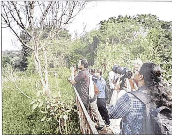
During a three-month exercise in the first leg, which started on Oct 1, Delhi Development Authority and World Wildlife Fund have planned various activities

ment director, WWF, said, "Given the reserve forest's rich diversity of flora and fauna, its status as home to a number of birds, reptiles, butterflies, mammals, etc. and its pristine character, visiting the Sanjay Van becomes even more interesting. The exercise aims to promote the partnership of citizens in preserving city forests and animals and to encourage nature-based learning."