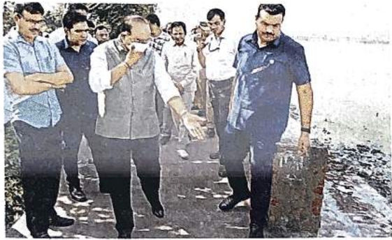
भलस्वा झील का मुआयना करते हुए वीके सक्सेना

जागरण संवाददाता, बाहरी दिल्ली : उपराज्यपाल (एलजी) वीके सक्सेना ने शनिवार को उत्तर-पश्चिम दिल्ली में भलस्वा झील का दौरा किया। उन्होंने झील को राजधानी के लिए अमूल्य संपत्ति बताया, लेकिन इसकी दयनीय स्थिति पर निराशा भी जताई। उन्होंने दिल्ली जल बोर्ड को झील के रखरखाव पर ध्यान देने के साथ ही दिल्ली विकास प्राधिकरण (डीडीए) को छठ पूजा के लिए झील की सफाई करने के निर्देश दिए। उन्होंने संबंधित एजेंसियों