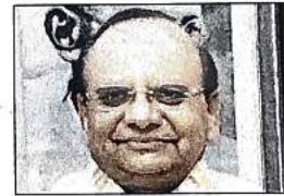
• वी के सक्सेना, उपराज्यपाल

एलजी ने अधिकारियों को निर्देश दिए कि दिसंबर माह तक यहां जल निकाय की पूर्ण बहाली और कार्यालय को सुनिश्चित किया जाए। उन्होंने डीडीए अधिकारियों को निर्देश दिया कि एक सप्ताह के भीतर झील के किनारों की सफाई कर इसे छठ पूजा के लिए तैयार किया जाए।