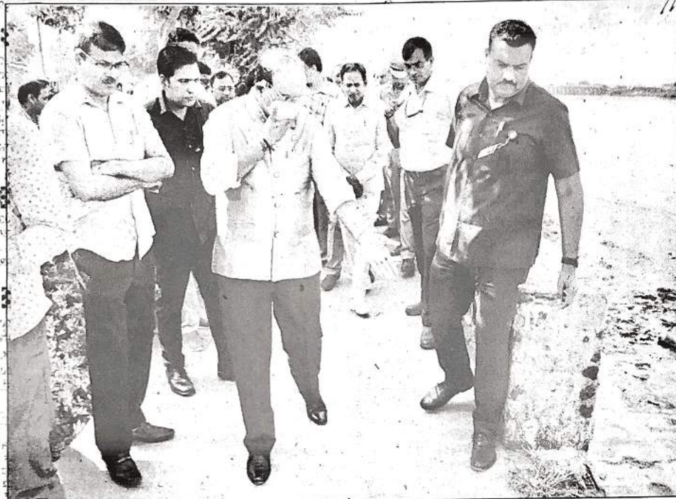
भलस्वा झील का निरीक्षण करते उपराज्यपाल वीके सक्सेना।