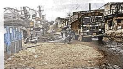
किराड़ी 70 फुट रोड की जर्जर सड़क • जागरण

राज्य ब्यूरो, नई दिल्ली: दिल्ली सरकार लोक निर्माण विभाग (पीडब्ल्यूडी) के अंतर्गत आने वाली सभी सड़कों को एक सप्ताह के अंदर गड़ढा मुक्त करेगी। पिछले दिनों हुई अप्रत्याशित वर्षा के कारण सड़कों को काफी नुकसान हुआ है। इसे देखते हुए सरकार ने निर्णय लिया है कि आमजन को आवाजाही में