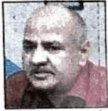
पीडब्ल्यूडी के अधिकारियों से मांगी रिपोर्ट

पीडब्ल्यूडी के अधिकारियों को आदेश दे दिए गए हैं। बीते दो सप्ताह में दिल्ली में अप्रत्याशित बारिश हुई है और इससे सड़कों को