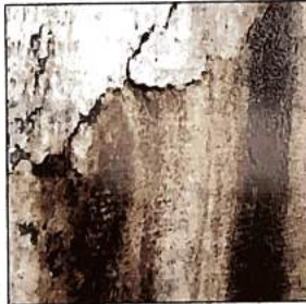
ऐसे ही रिसता रहता है पानी