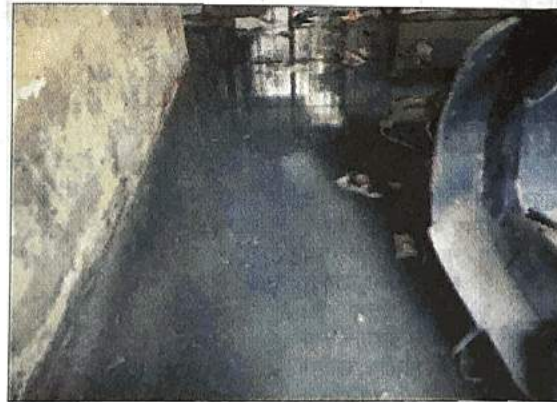
▶▶ घरों में भरा सीवेज का गंदा पानी।