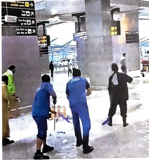
आइजीआइ एयरपोर्ट के टी-3 पर पानी हटाते कर्मचारी

● डायवर्ट विमानों में छह जयपुर तो एक विमान को भेजा गया इंदौर