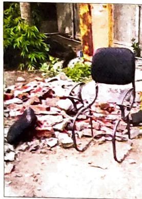
अतिक्रमण पर कार्रवाई के दौरान तोड़ा