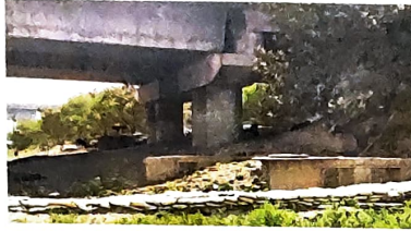
(Left) Work on the ghat began about a month ago; the proposed plan

Today, the Qudsia Bagh lies across the road from the river, with the road separating the garden and the ghats.