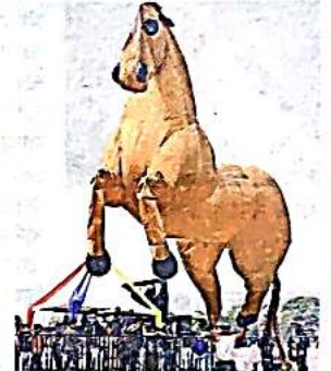
सराय काले खां स्थित बांसेरा पार्क में उड़ती होर्स काइट

शामिल हुए। उनकी भव्य ड्रैगन काइट और 50 फीट की स्नेक काइट ने दर्शकों का खूब ध्यान खींचा। इसके अलावा कंकाल काइट ने बच्चों से लेकर बड़ों तक को हैरान किया। वहीं हवा में उड़ते कंकाल को