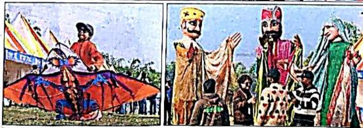
बांसेरा में आयोजित कार्यक्रम के मौके पर एलजी वी के सक्सेना और सीएम रेखा गुप्ता मौजूद रही

गृहमंत्री ने पतंग महोत्सव को और भव्य तरीके से आयोजित करने के निर्देश दिए हैं। मुझे विश्वास है कि आने वाले सालों में इसकी भव्यता बढ़ेगी। -एलजी वी के सक्सेना