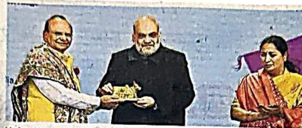
Union Home Minister Amit Shah flanked by CM Rekha Gupta (right) and L-G V.K. Saxena at the inauguration of the International Kite Festival at Baansera Park on Friday.