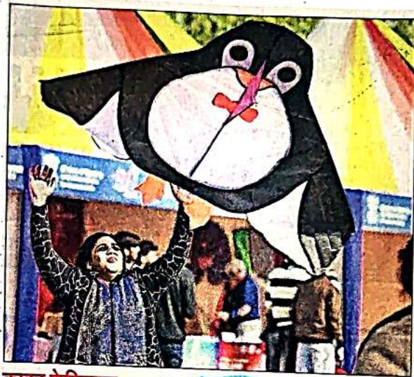
काइट फेस्टिवल: यमुना किनारे डीडीए बांसेरा पार्क में चल रहे पतंग उत्सव में बच्चे समेत हर वर्ग के लोगो ने शनिवार को जमकर हिस्सा लिया