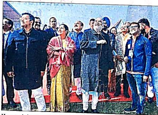
Home minister Amit Shah flies a kite at the third International Kite Festival at Baansera Park on Friday.

The event was attended by LG VK Saxena, chief minister Rekha Gupta, senior officials of the DDA and representatives from various kite-flying associations. This year's festival is being hosted at Baansera Park, a bam-