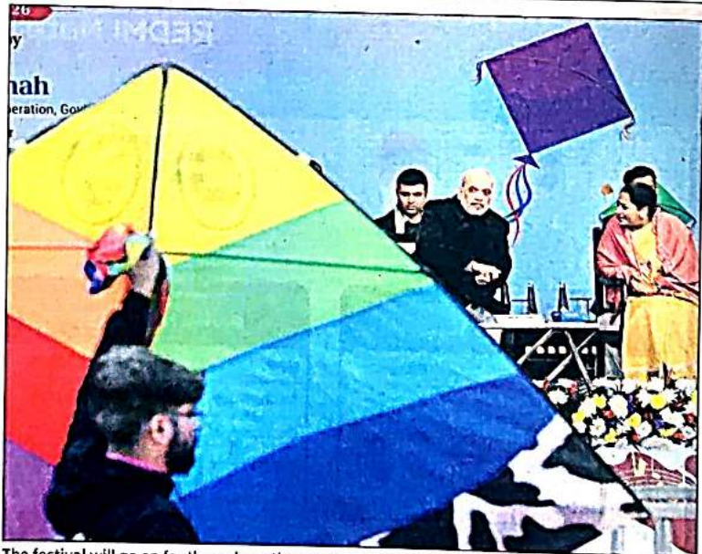
The festival will go on for three days; the event was opened by Amit Shah in CM's presence

tation at the last moment, I managed to complete all preparations, including making my kites."