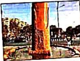
खूबसूरती बढ़ाने के लिए लगाया