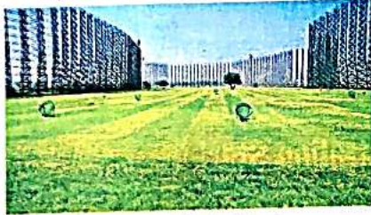
द्वारका गोल्फ कोर्स में नजर आती हरियाली

1.80 लाख रुपये पांच साल का सदस्यता शुल्क सरकारी कर्मचारियों को देना होगा