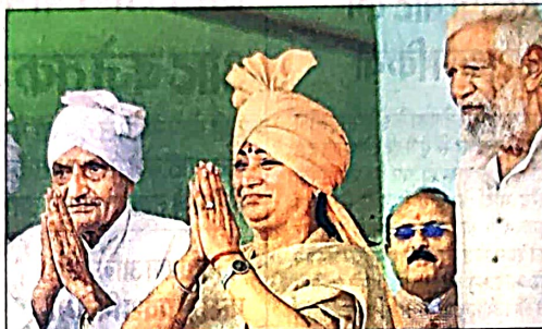
नई दिल्ली के हिरणकुंदना गांव में बुधवार को लोगों का अभिवादन स्वीकार करती मुख्यमंत्री रेखा गुप्ता। इस कार्यक्रम में कई परियोजनाओं का शुभारंभ किया गया। •

बुधवार को बाहरी दिल्ली स्थित हिरणकुंदना गांव के सीएम श्री स्कूल में विकसित नए खेल परिसर का