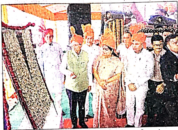
उपराज्यपाल और मुख्यमंत्री ने बुधवार को ग्रामोदय अभियान के तहत विकास परियोजनाएं लॉन्च कीं। अमर उजाला

कई पाकों को नए सिरे से तैयार किया गया। कई खाली जगहें, जहां पहले धूल उड़ती थी, इन्हें हरित क्षेत्र में तब्दील किया है। खासकर महिलाओं, बच्चों के लिए बेहतर स्थान विकसित हुआ है। पाकों में आधुनिक तकनीक वाले ओपन ज़िमे लगाए हैं। इनमें से कई परियोजनाओं पर तेजी से काम चल रहा है।