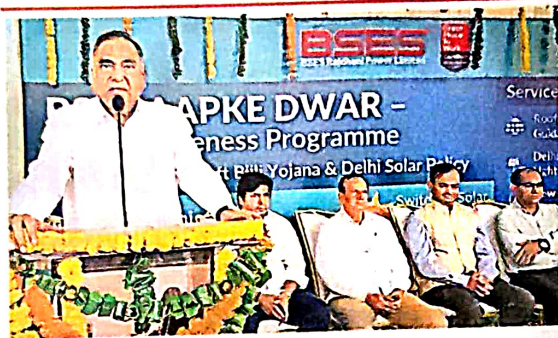
तुगलकाबाद गांव में सौर ऊर्जा कनेक्शन के लिए लगाए गए पंजीकरण शिविर के दौरान लोगों को संबोधित करते सांसद रामवीर सिंह बिधूड़ी

● तीन किलोवाट के कनेक्शन पर एक लाख आठ हजार रुपये की दी जा रही सब्सिडी