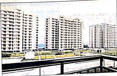
द्वारका सेक्टर-19बी गोल्फ व्यू अपार्टमेंट। फाइल

गोल्फ व्यू अपार्टमेंट्स डीडीए की द्वारका-आवास योजना 2024 का हिस्सा हैं। ये डीडीए की सबसे