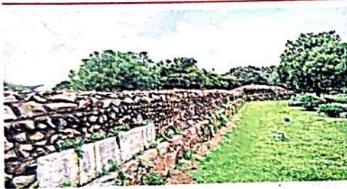
पृथ्वीराज चौहान के किला राय पिथौरा की संरक्षित दीवार

● राजा अनंगपाल के किला के अवशेष कुतुबमीनार के पास मिले