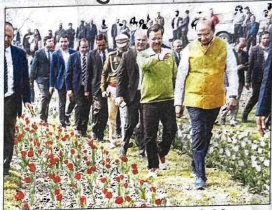
एलजी ने सीएम और परिवहन मंत्री को बॉसेरा पार्क भी दिखाया

जनता को बधाई देते हुए एलजी ने कहा कि सराय काले खां स्थित डीडीए का बॉसेरा पार्क, जो दिल्ली की सबसे नई इको फ्रेंडली डेस्टिनेशन भी है, वहां से हमने 350 नई इलेक्ट्रिक बसों को रवाना किया। इसी के साथ दिल्ली में चलने वाली इलेक्ट्रिक बसों की संख्या बढ़कर 1650 हो गई है। इनमें से 900 बसें भारत सरकार की FAME-2 योजना के तहत दिल्ली को मुहैया कराई गई हैं, ताकि प्रदूषण को कम किया जा सके और शहर में एक मजबूत ग्रीन पब्लिक ट्रांसपोर्ट इन्फ्रास्ट्रक्चर तैयार किया जा सके। एलजी ने सीएम और परिवहन मंत्री को बॉसेरा पार्क भी दिखाया, जहां बॉस के पौधों और आकर्षक कलाकृतियों के बीच ट्रूलिप के सुंदर फूल भी खिल रहे थे।